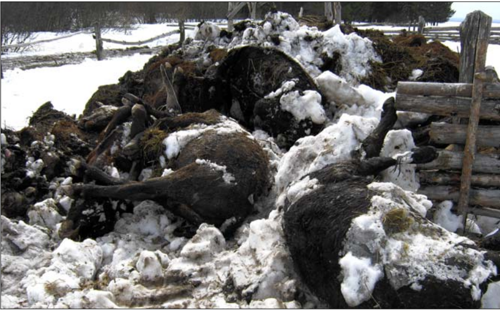
Flere end 100 køer bukkede under for sult på farmen i vinteren 2009. Banditter havde stjålet af deres foder, og temperaturen faldt til under 40 minusgrader. Alternativet var at sende dem til slagting, men myndighederne forlangte en stor bestikelse for at udskrive de nødvendige veterinærattester.