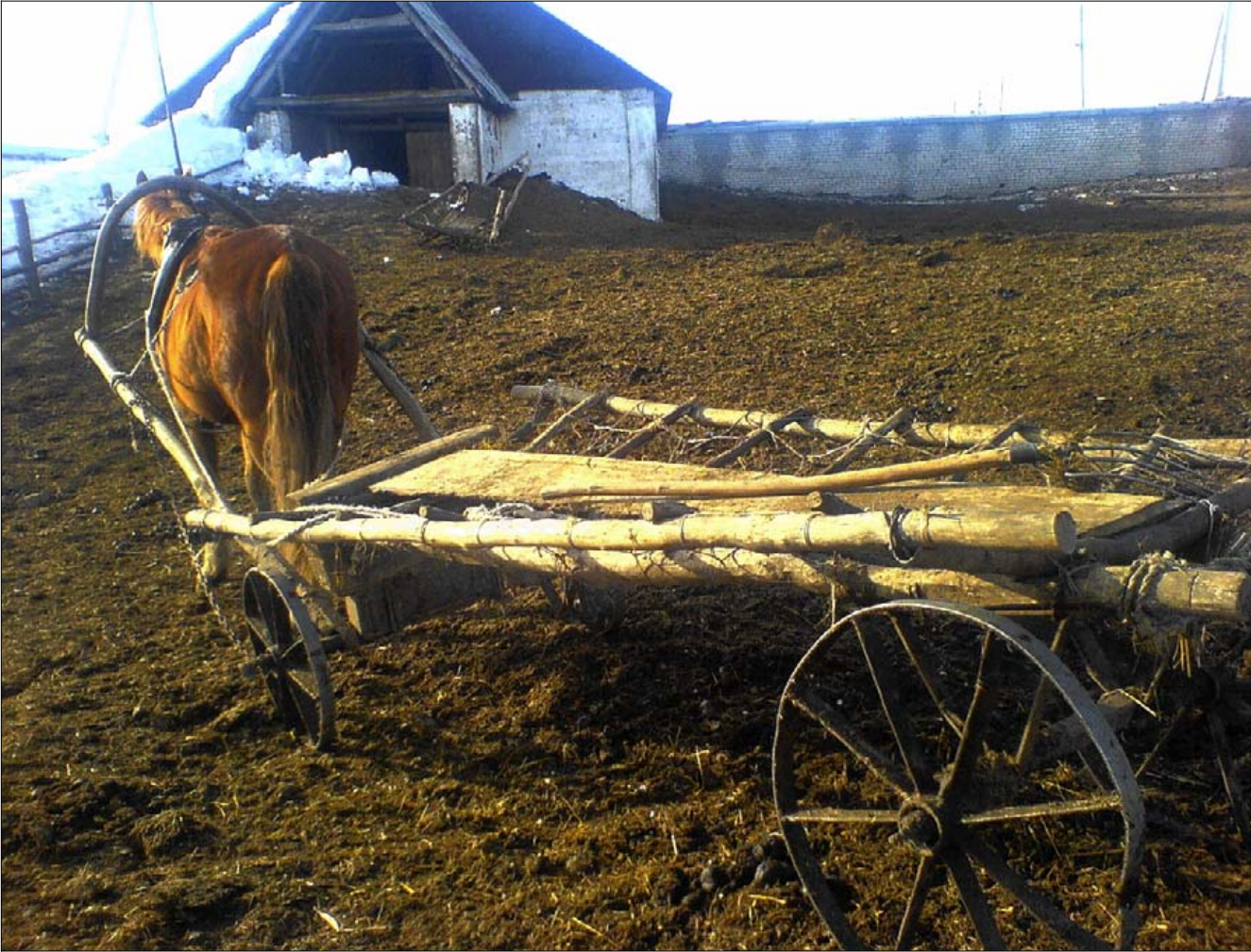
Foruden traktorer bruges der en del heste i arbejdet på farmen.